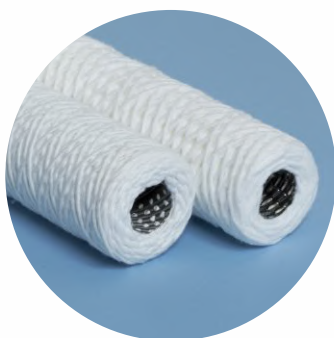
Cartouche Bobinée avec tube intérieur de acier inox

Les cartouches en polypropylène sont conformes aux exigences de la FDA ( Règlement 21cfr186.1673 ) pour les produits en contact alimentaire et généralement reconnus comme sûrs ( GRAS ). Dorsan® a été enregistrée sûr le Dossier de Santé # RSIPAC : 39.05248 / CAT.